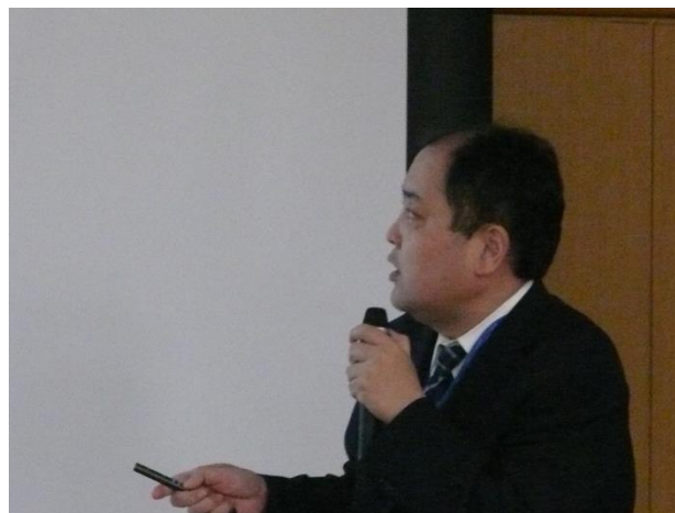
【 置換法を用いたバイコンカルアンテナの校正 】