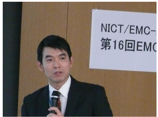
【 光電界プローブ及び その校正法に関する研究開発 】