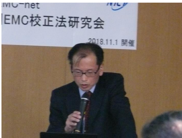
【 CISPR SC-A 釜山会議 報告 】