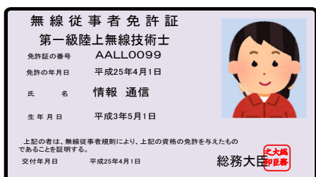
操作する人の能力